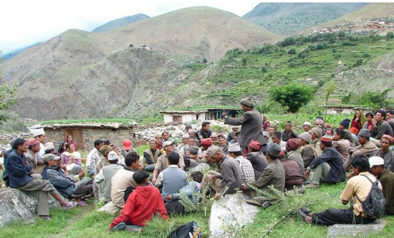
Audience et audit communautaires. Dolpa, Népal.