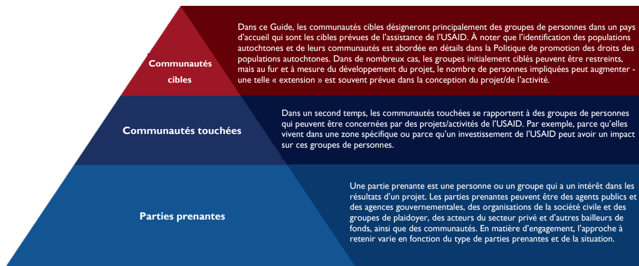
Figure 1. Types de communautés et définitions

Toutes les parties à un processus d'engagement doivent être d'accord sur le type d'engagement et les résultats escomptés, ce qui permet de gérer les attentes de toutes les parties.